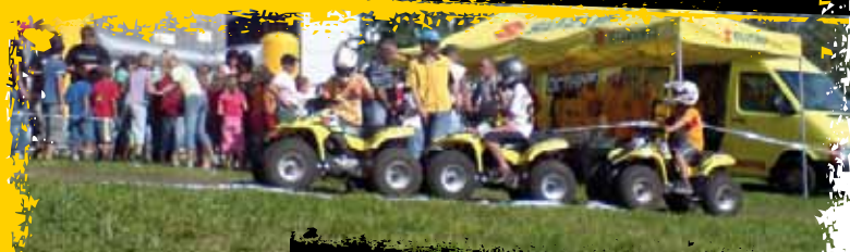
KINDEREVENTFLÄCHE MIT QUADPARCOURS, SCHMINKEN MIT CLOWNS UND HÜPFBURG