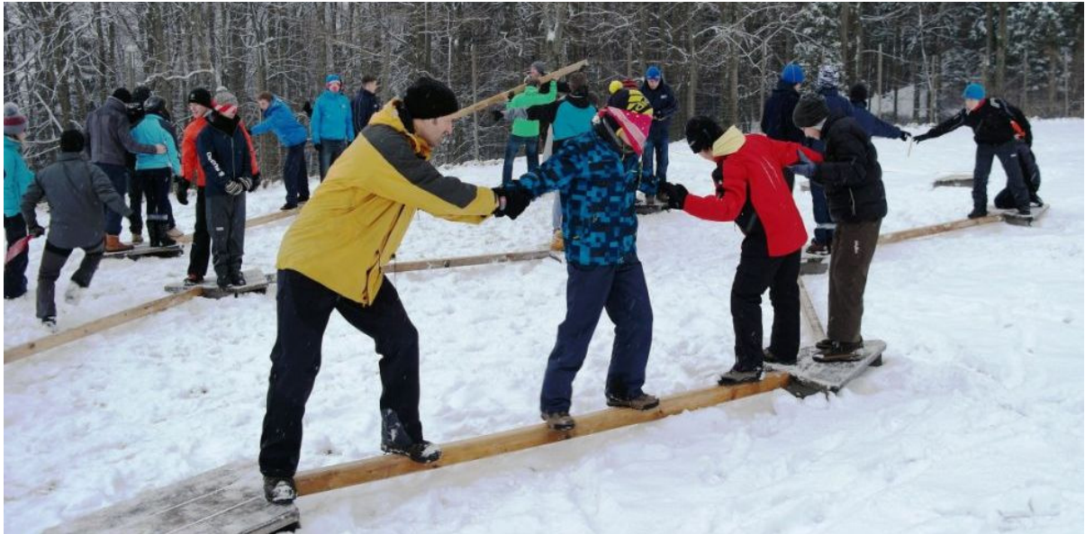
„Flußüberquerung“ mit Balken und Handicaps