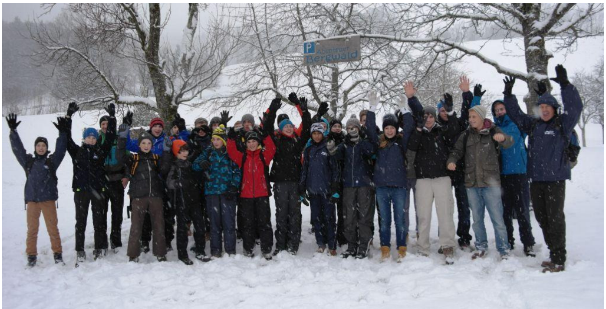
Auftakt zum „Abenteuer Bergwald“ am Sagberg bei Frasdorf mit anschließender Wanderung auf die Frasdorfer Hütte