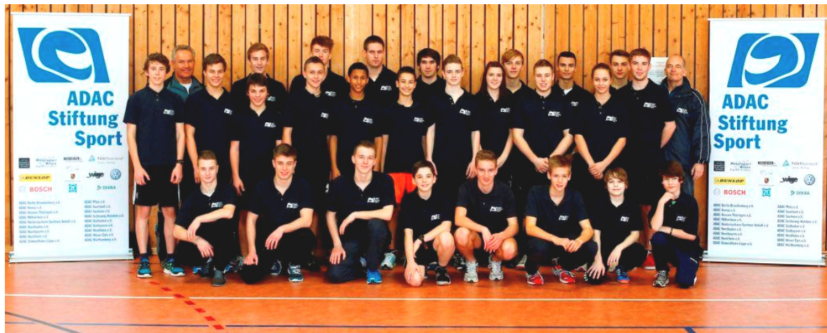
Teamfoto der Geförderten in der Sporthalle des Leistungstützpunktes der Bundespolizei

Tel. +49 89 76 76 6936, Mobil +49 171 5 55 5936, kay.langendorff@adac.de