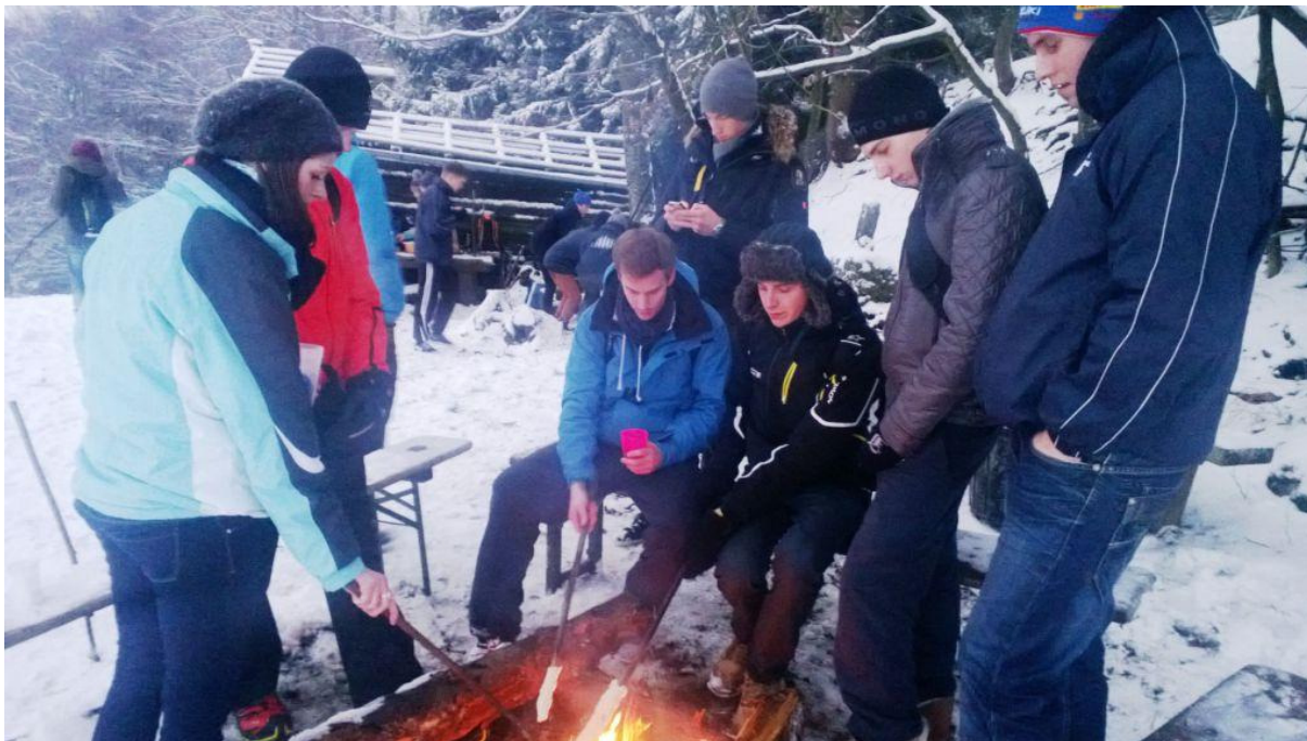
Nach erfolgreicher Teamarbeit Stockbrotgrillen mit wärmenden Motorsportgesprächen